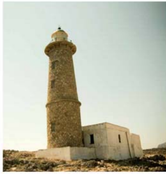
Ο κτίριος Φάρος των Αντικυθήρων. | The stone built lighthouse of Antikythera.