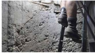
...είναι ακόμη σε χρήση!