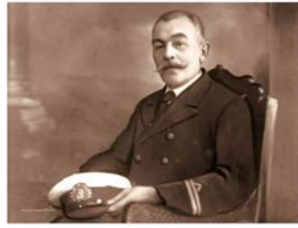
Ο Νικόλαος Φίλοσοφοφ ήταν γόνος αριστοκρατικής οικογένειας, ευπαιδευμένος και Αιγινης της Ρωσσοβίας και της μουσικής.