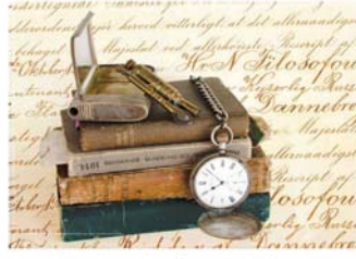
Κάποιος από τα λιγοστά προσωπικά αντικείμενα που έφερε μαζί του ο Φίλοσοφοφ αφήνοντας για πάντα τη Ρωσία.