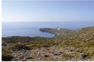
Αγωνισώντας το κύμα από το νοτιότερο άκρο των Αντικυθήρων.