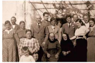
Ο Ναύαρχος Φίλοσοφοφ σε αυτή των Κυθήρων το 1938.