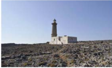
Προσγγίζοντας το Φάρο από το μονοπάτι.