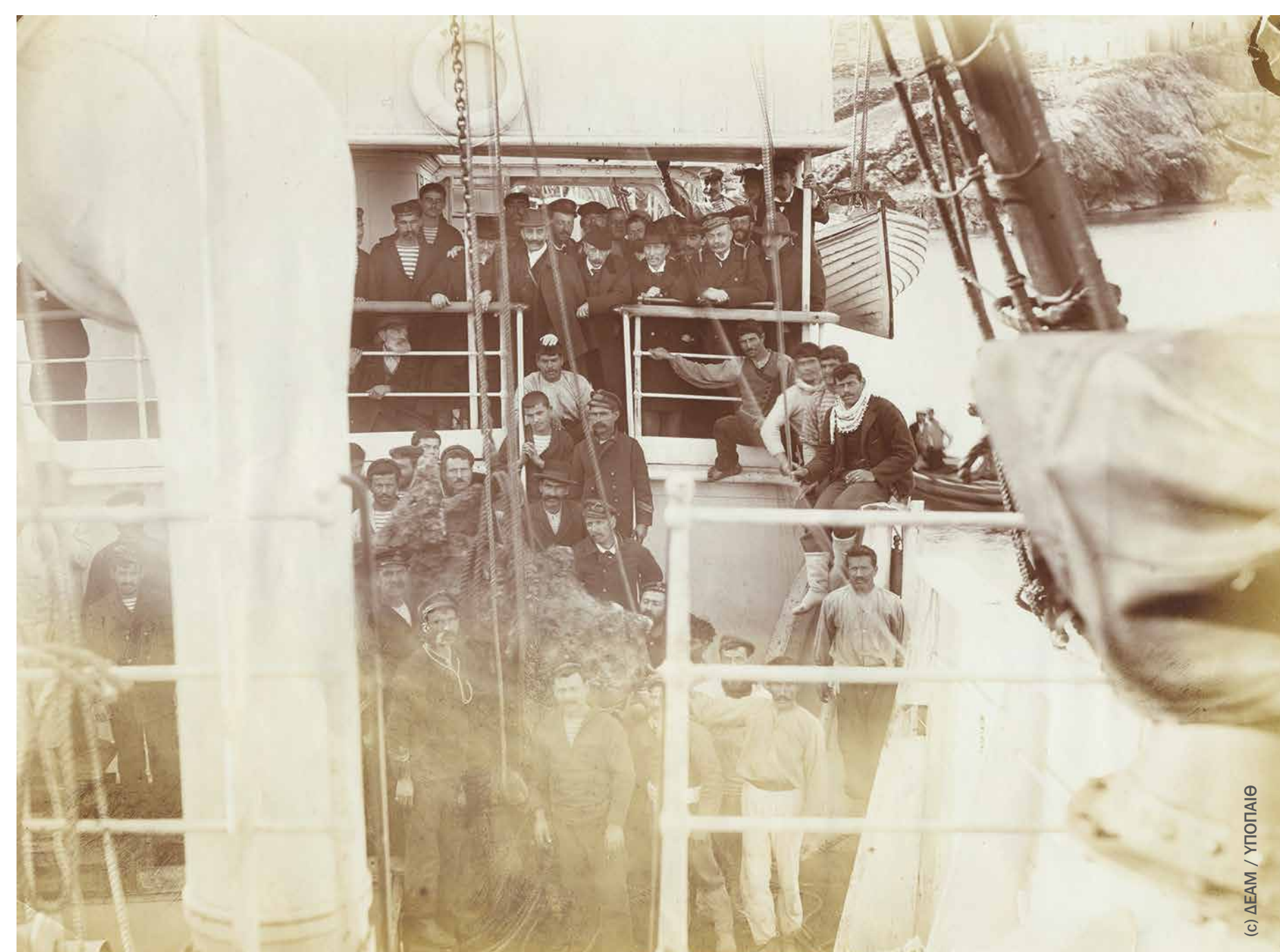
Η πρώτη αποστολή (1900-1901) στο κατάστρωμα του οπλιταγωγού ΜΥΚΑΛΗ. Διακρίνονται μέλη του πληρώματος, στελέχη του Υπουργείου Παιδείας και οι Συμιακοί σφουγγαράδες.

The first expedition (1900-1901) on board MYKALI. One can notice members of the crew, officials from the Ministry of Education, and the sponge divers from Symi.