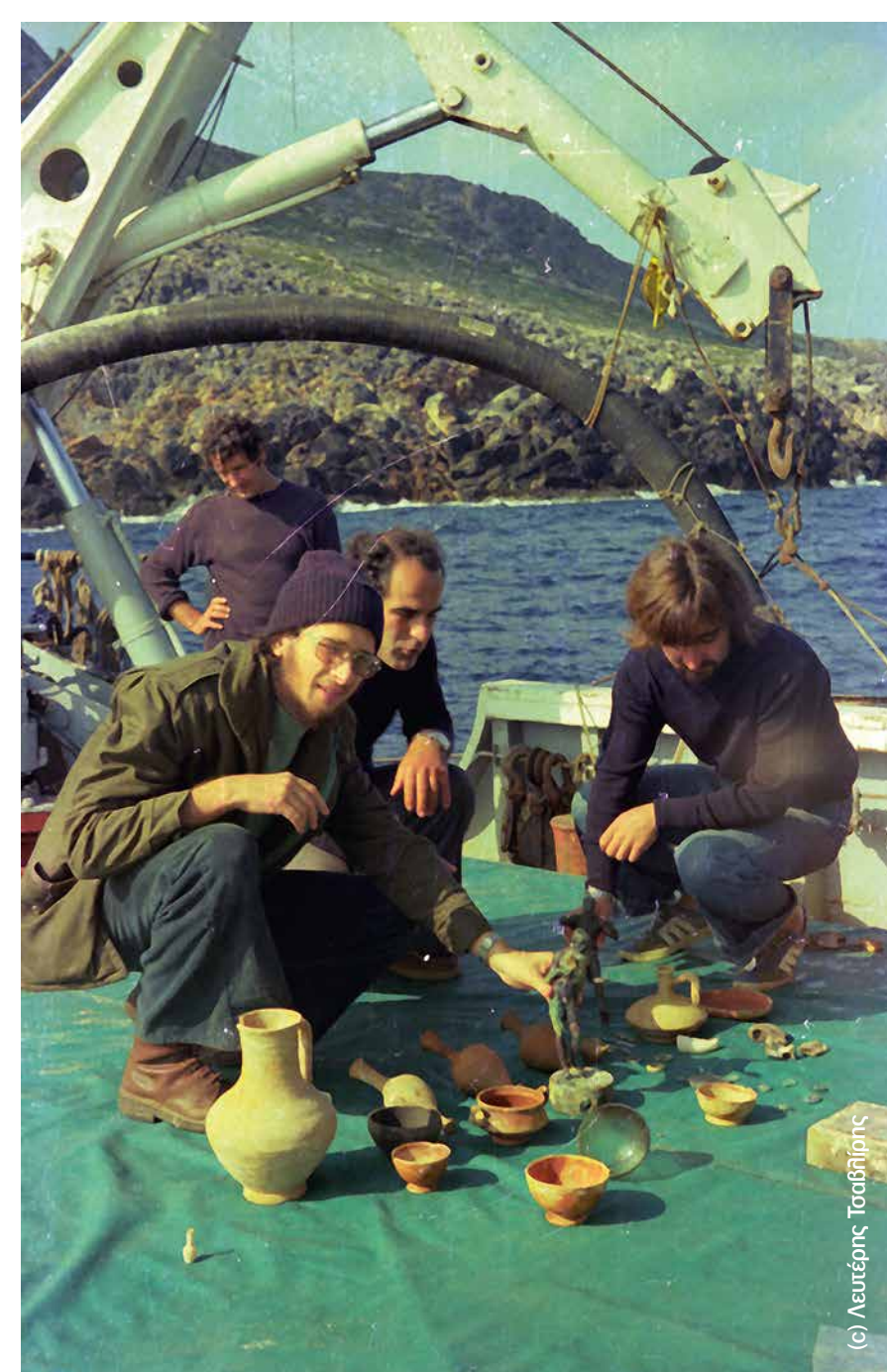
Πάνω στο Καλυψώ (1976).

The first expedition (1900-1901) on board MYKALI. One can notice members of the crew, officials from the Ministry of Education, and the sponge divers from Symi.