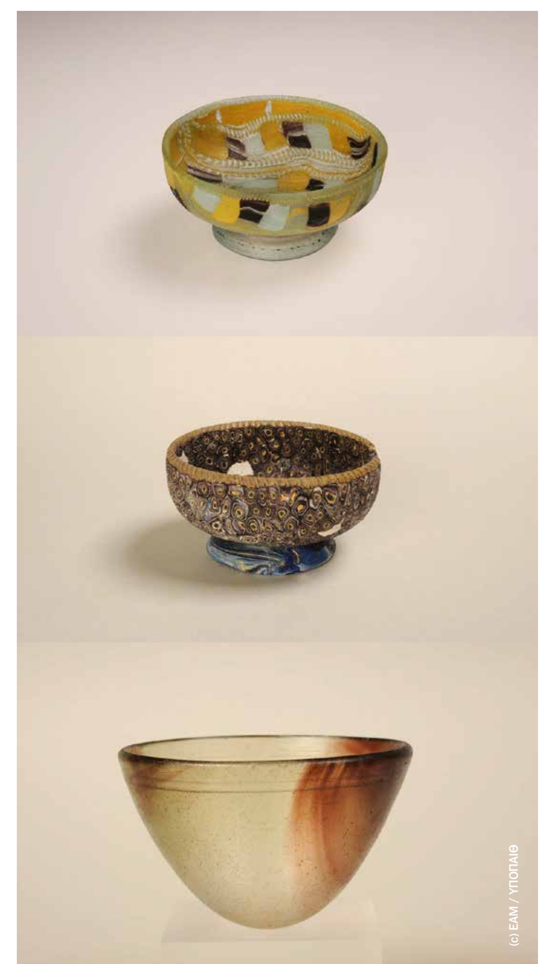
Γυάλινα αντικείμενα. | Glassware.