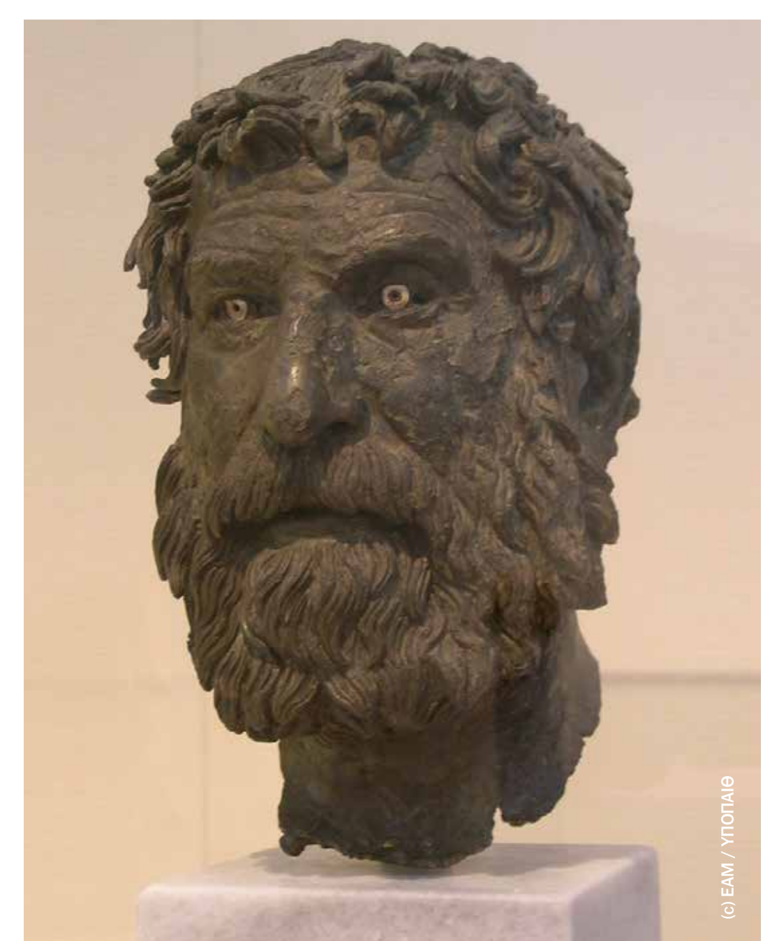
Ο Φιλόσοφος των Αντικυθήρων. The Antikythera Philosopher.