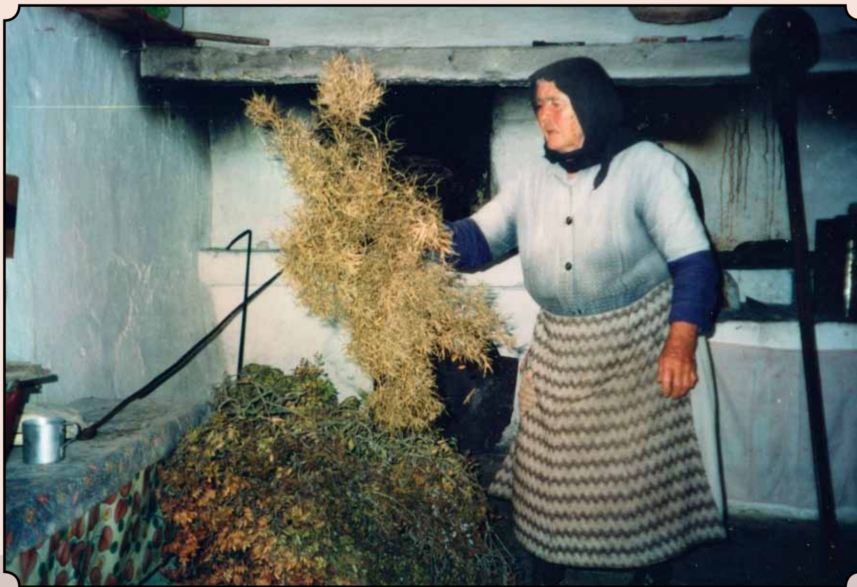
Προετοιμασία για το άναμμα του φούρνου