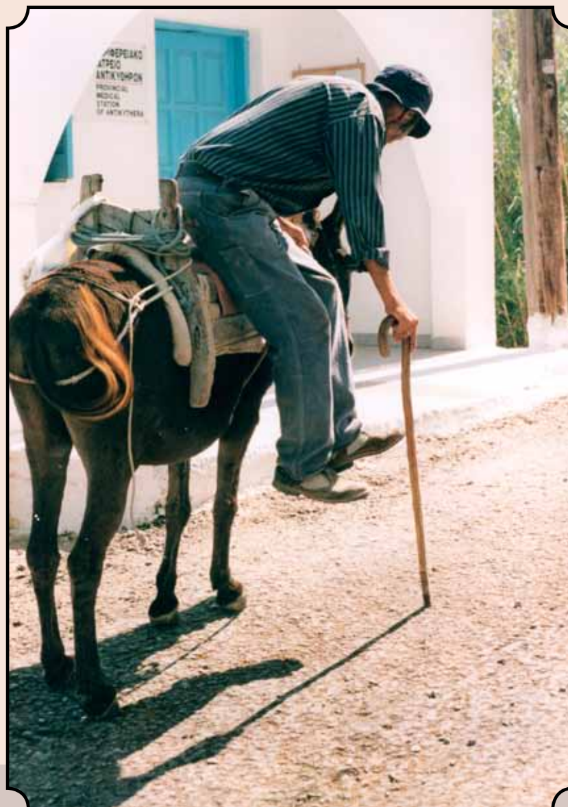
Επίσκεψη στο αγροτικό ιατρείο για εξέταση της πίεσης