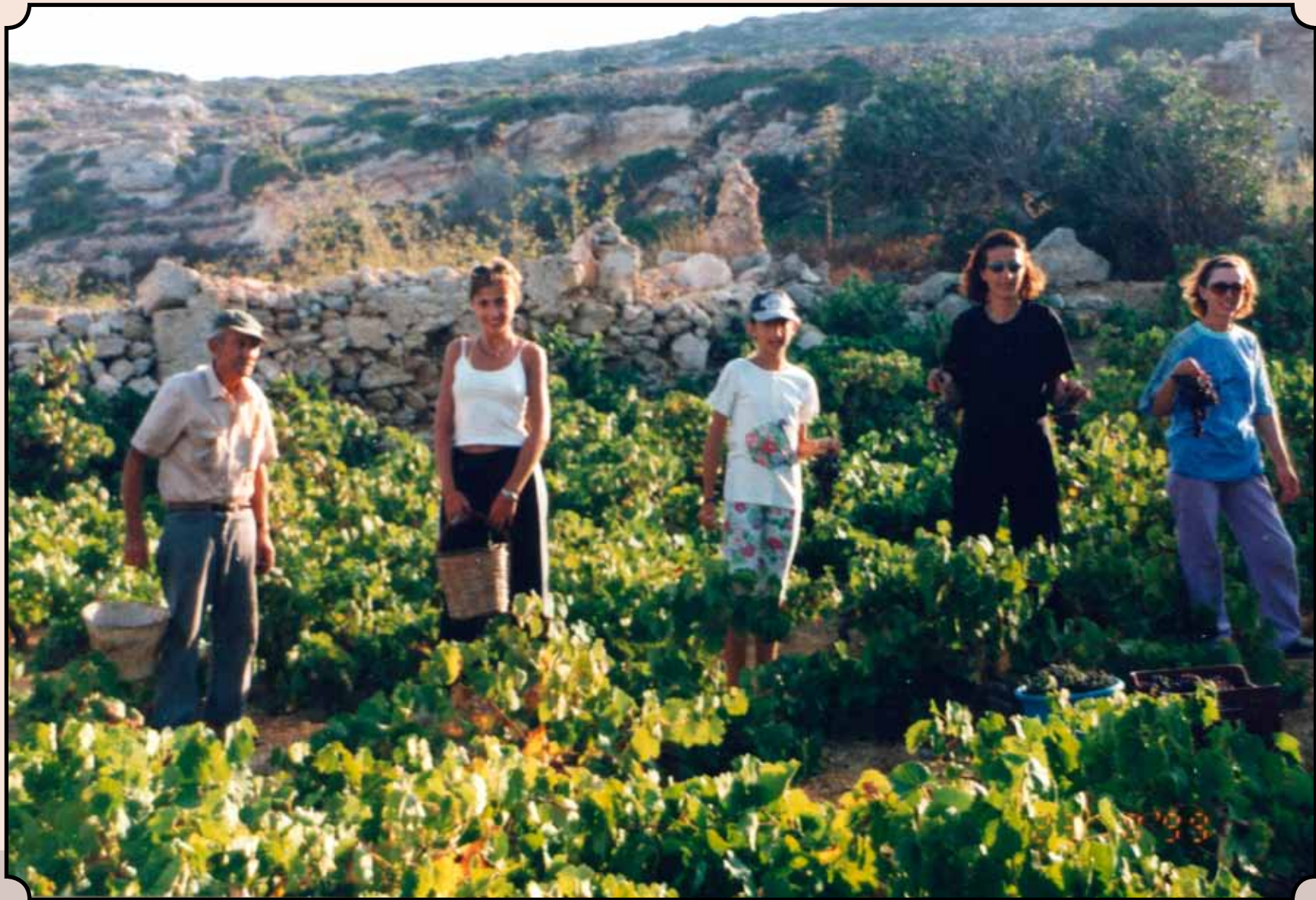
Τρυγητό στα αμπέλια