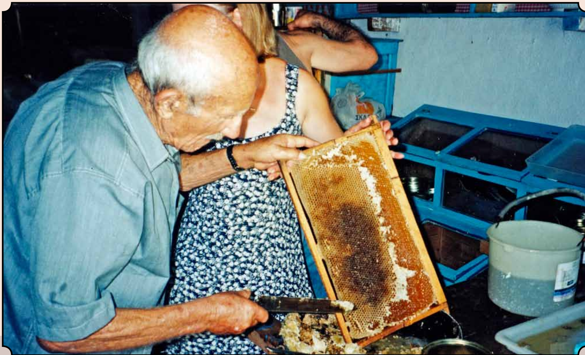
Παραγωγή μελιού στα Αντικύθηρα