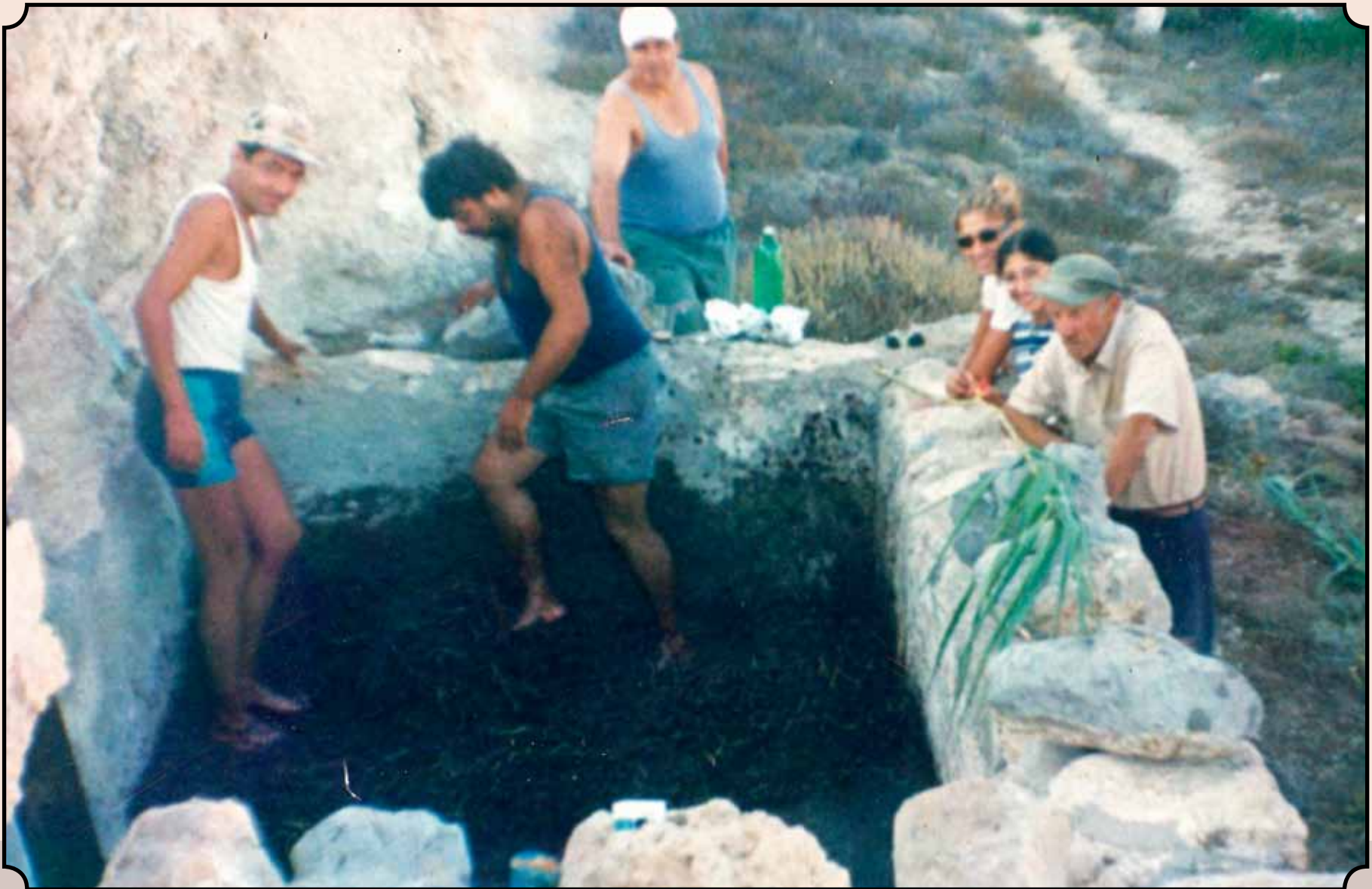
Αντικυθήριοι πατούν τα σταφύλια στο λανό