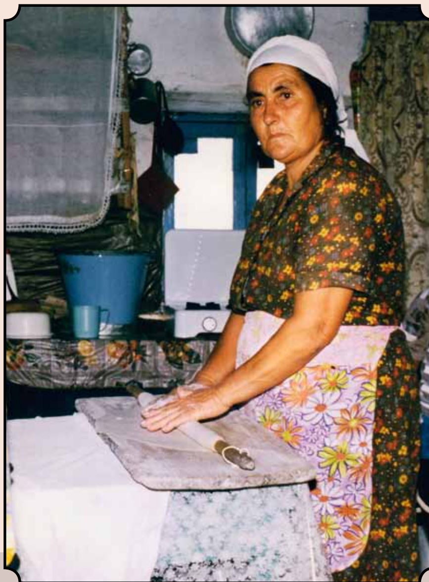
Περίφανη Συμπατριώτισσα ανοίγει φύλλο