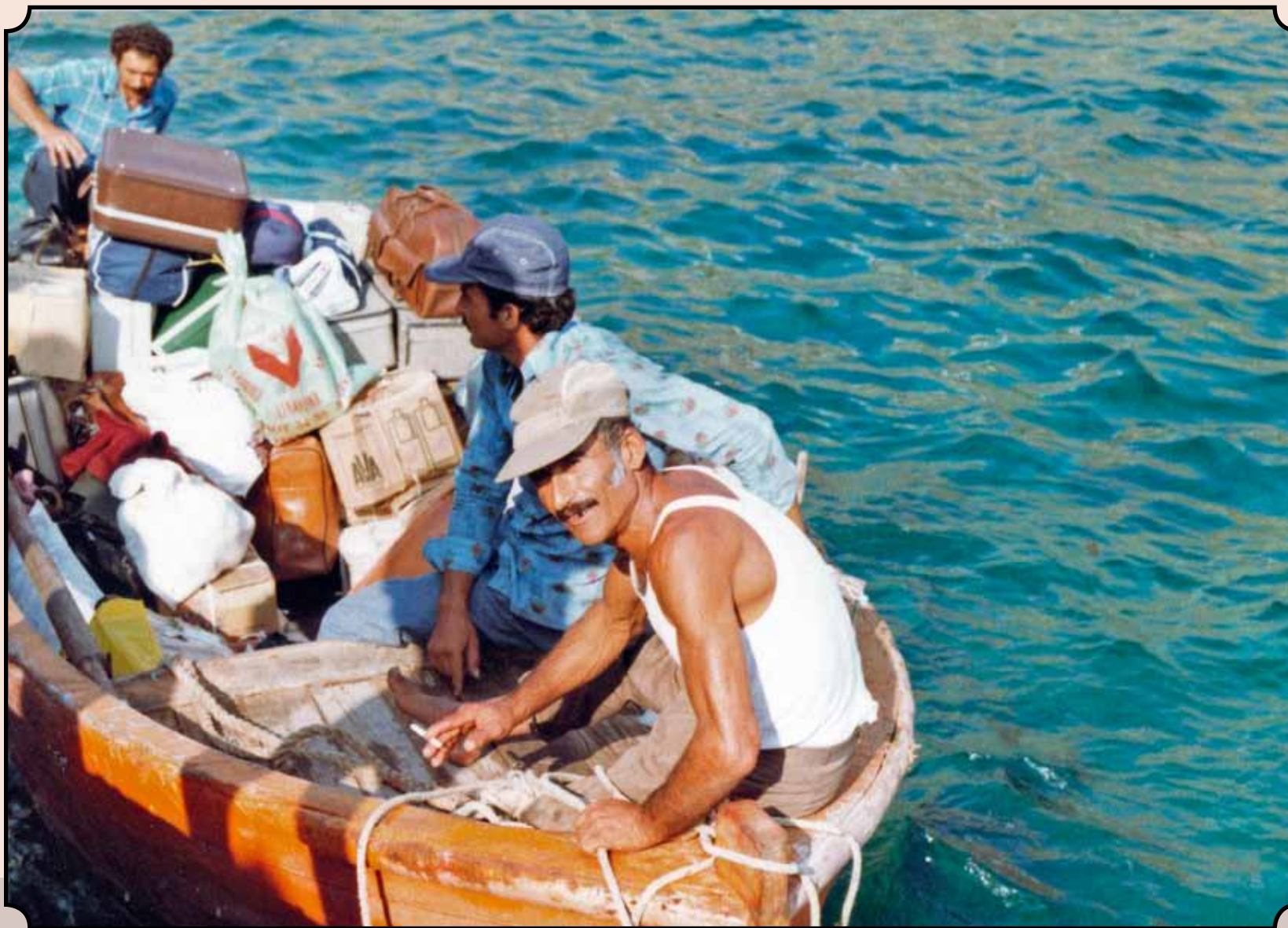
Οι αποσκευές μας εκφορτώνονται από το πλοίο με βάρκα