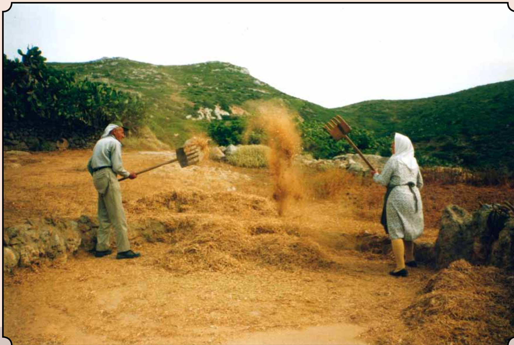
Λίχνισμα στο αλώνι