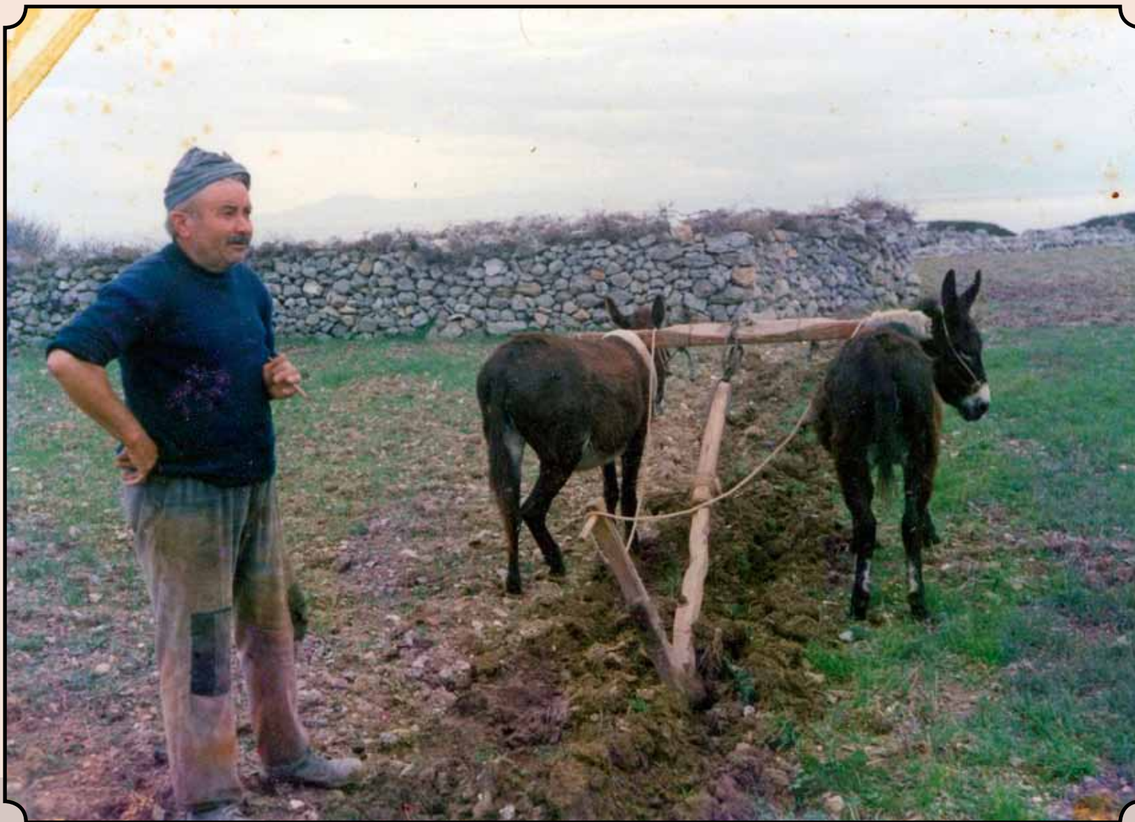
Οργώνοντας το χωράφι