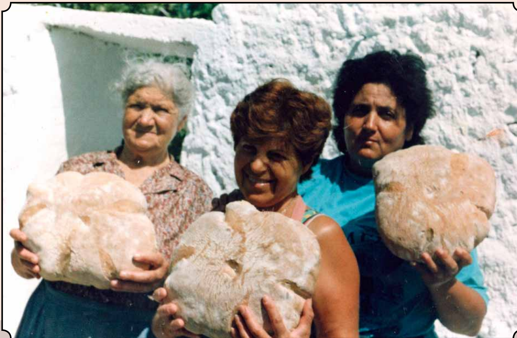
Οι Αντικυθήριες και το ψωμί του πανηγυριού