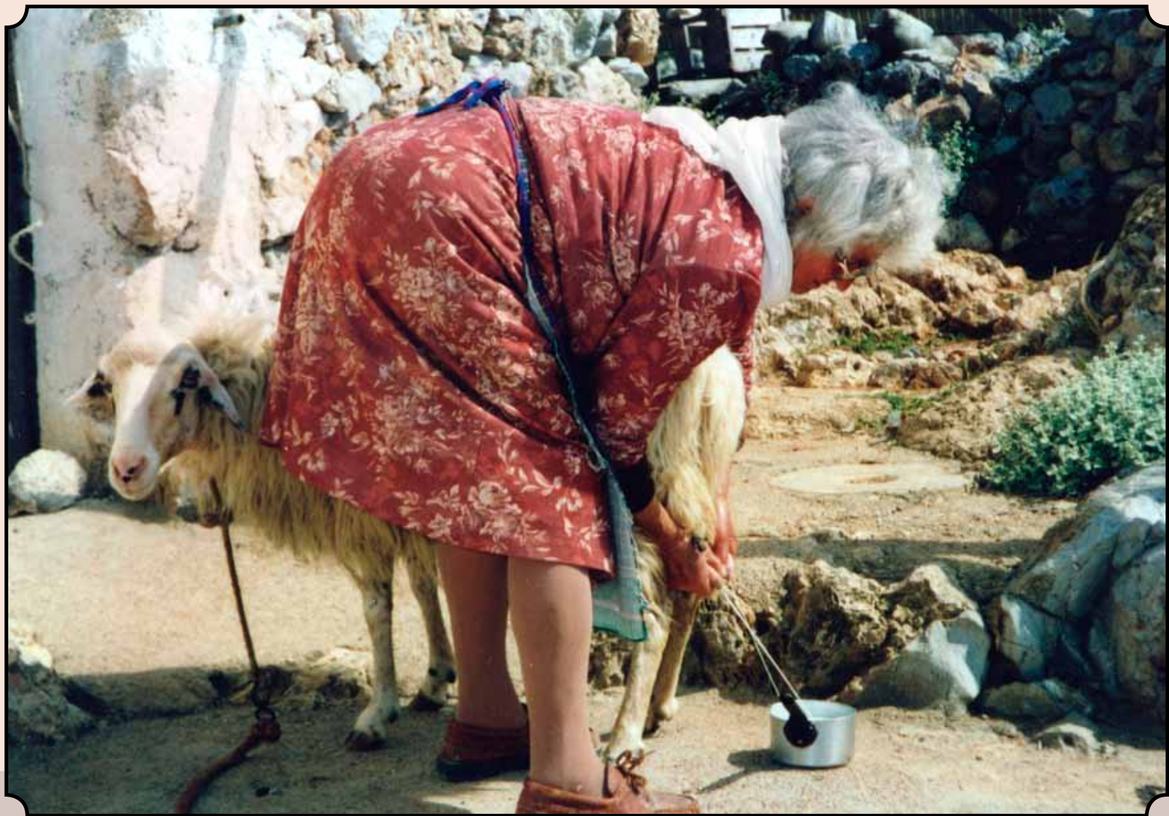
Η γιαγιά αρμέγει το πρόβατό της