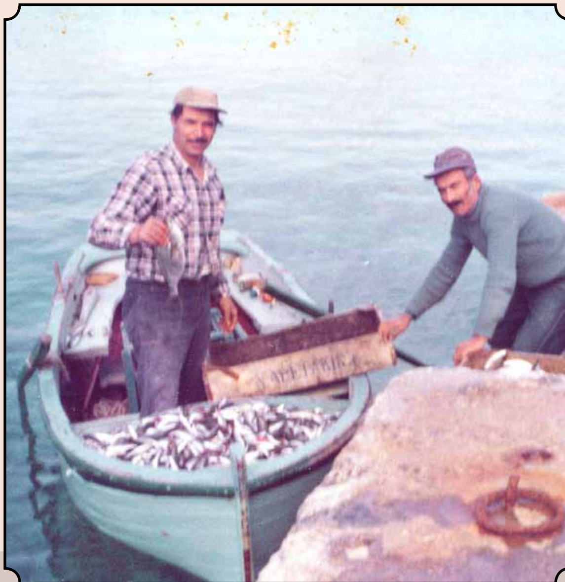
Επιστρέφουμε από το ψάρεμα